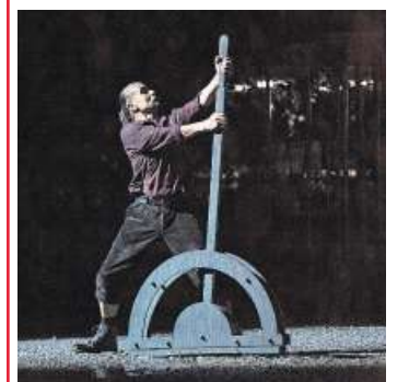
Szene aus «Göschenen am Meer».

Nidwalden Pro Senectute Nidwalden meldet für den Monat August folgende Anlässe: